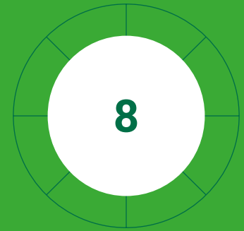
inscrits titulaires d'un permis d'adjoint au médecin