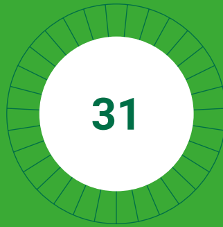
inscrits titulaires d'un permis de médecin agréé